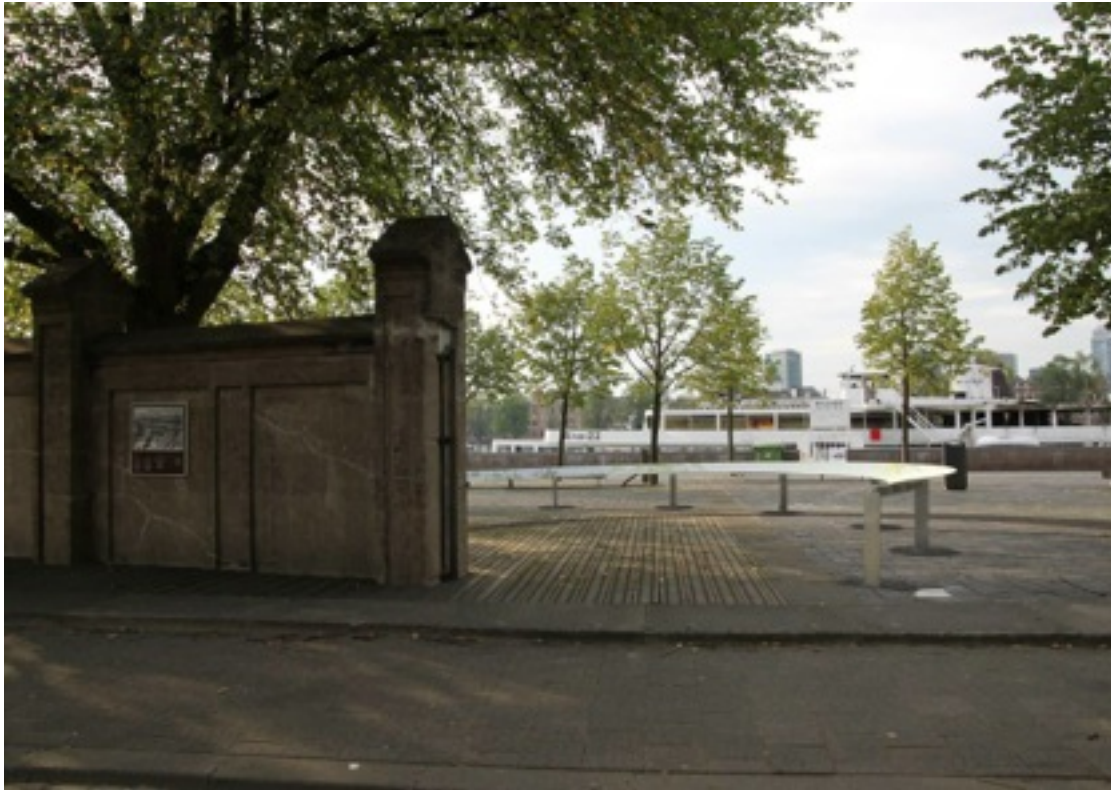
Het muurtje van Loods24 en het Joods Kindermonument

het project uitvoeren (wellicht in aangepaste vorm). Jaarlijks bezoekt een groep het Kindermonument en/of de Stolpersteine.