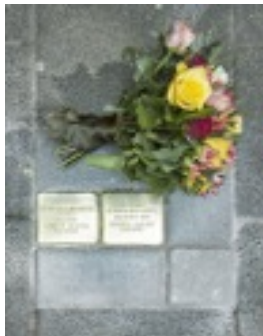
Stolpersteine in de omgeving van de Wilhelminaschool, Kralingen-Crooswijk

In de omgeving van de Wilhelminaschool zijn ook Stolpersteine te vinden van families die zijn weggevoerd: