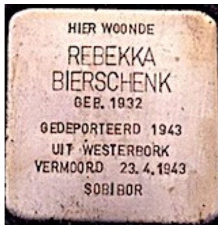
Stolpersteine van twee zusjes, 10 en 11 jaar oud.....