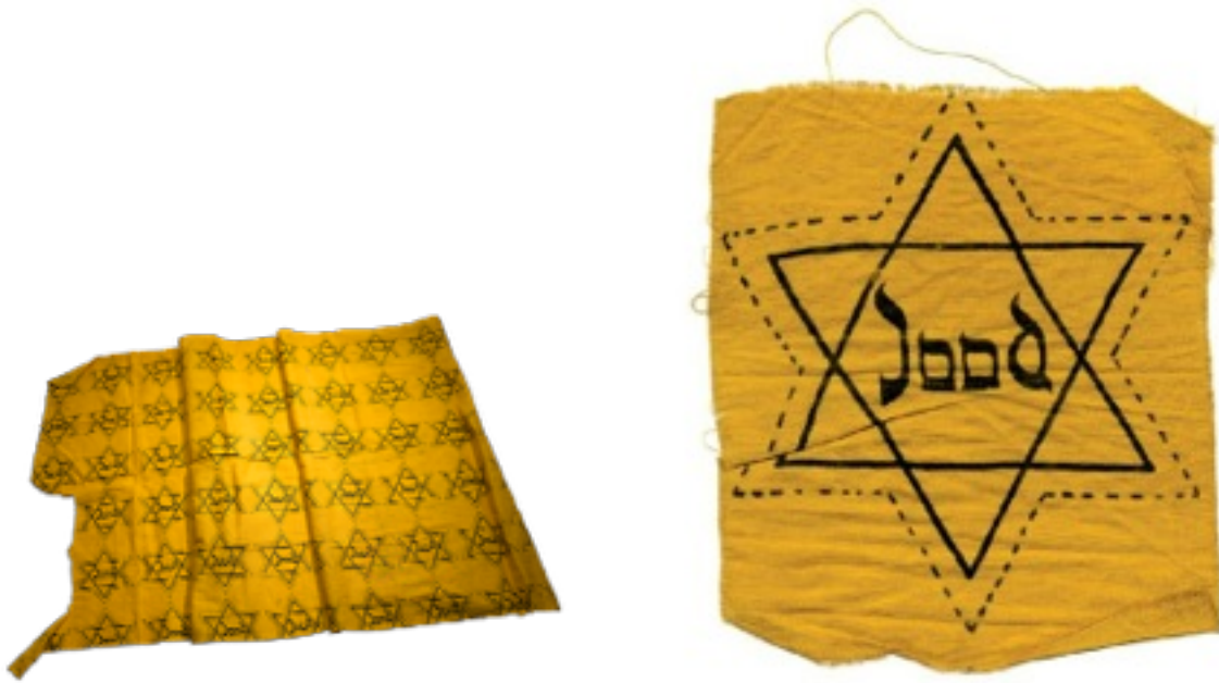
De "ster" die zichtbaar gedragen moest worden.